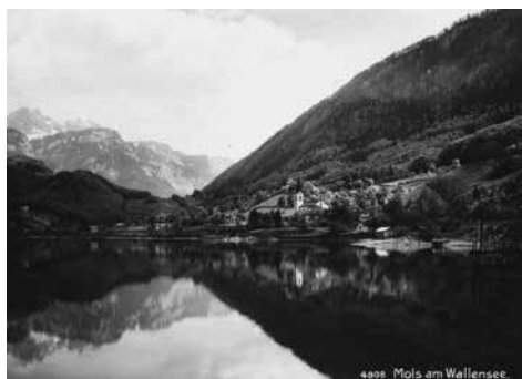
Mols am Walensee, 1931

Die Verantwortung über die Termine liegt bei den Vereinen.