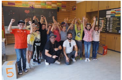
4. Klasse Quarten

Anfangs September hatte die dritte Klasse in Quarten das Vergnügen eine Musiklektion mit Bligg und Marc Sway zu geniessen. Im Rahmen der Klassenzimmertour von Blay (Bligg und Sway) hatte die Klasse von Frau Bolt die Möglichkeit am Wettbewerb der zwei Musiker teilzunehmen und mit etwas Glück können sie im 2022 mit Blay auf der Showbühne im Letziggrund auftreten. Die Kinder haben die Lektion mit den sympathischen Künstlern sehr genossen.